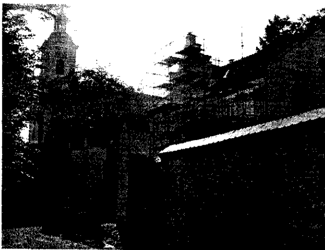
Budovy evangelického reformního sboru ve Velimi (foto 1), evangelická fara ve Velimi dnes v rekonstrukci (foto 2).