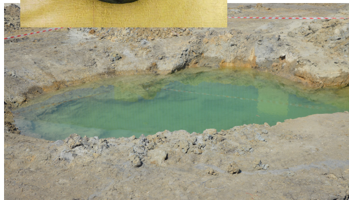
Studna s dřevěnými trámy v průběhu odkrývání (vlevo) a nyní