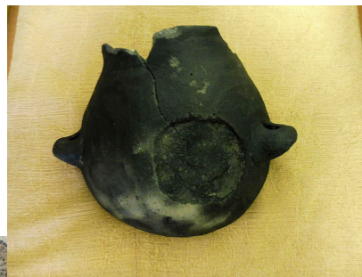
Polovina nádoby vytažená z neolitické studně

V blízkosti jednoho z domů pak byla objevena studna. Nálezy studní jsou vzácné, ve střední Evropě jich bylo objeveno jen několik. Tento nález je datován přibližně do období kolem roku 5 300 př. n. l. Vyzvednutí této studny bylo prací velice náročnou vzhledem ke spodní vodě. Ale právě uložení ve vodě umožnilo zachování organického materiálu. Asi metrové roubení studny je z dubových trámů, na dně ležel vydlabaný kmen, našla se také polovina nádoby na vodu s dochovaným útržkem provázku. Dalšími informacemi jsou např. pylová zrnka či pozůstatky rostlin, ze kterých se může usuzovat, jaké přírodní podmínky zde panovaly.