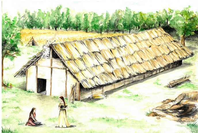
Život před dlouhým domem – kresba A. Sosnová

V této lokalitě se našly pozůstatky sídliště prvních zemědělců z mladší doby kamenné, zvané neolit. Tito nově příchozí lidé se zde usídlili po polovině 6. tisíciletí př. n. l. Podle výzdoby mluvíme o kultuře s lineární keramikou. V rámci výzkumu byly odkryty základy dlouhých domů, jednoduchých dřevěných staveb z kůlů, které zde měly rozměry až 7 x 40 m. Právě kůlové jamky zůstaly ukryté pod povrchem.